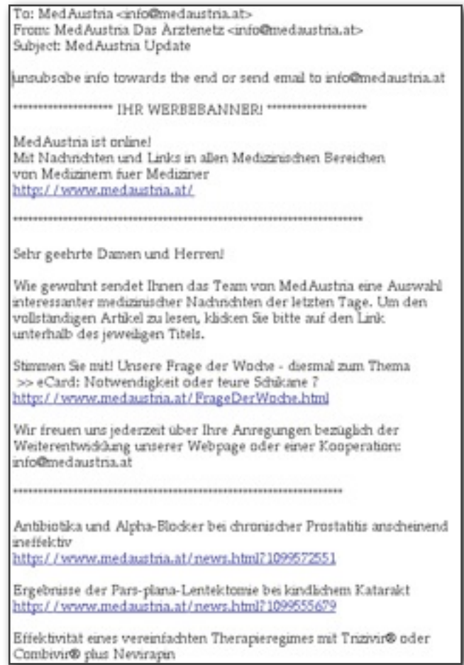
Beispiel für eine Newsletter Werbung

Wenn ein Artikel oder Advertorial nicht reicht, gestaltet die MedAustria Redaktion für Sie einen Schwerpunkt, etwa zu einem Kongress, Satellitensymposium oder einer Produkteinführung. Auf Wunsch können dazu auch Bilder, Linksammlungen, Präsentationen oder multimediale Inhalte publiziert werden.